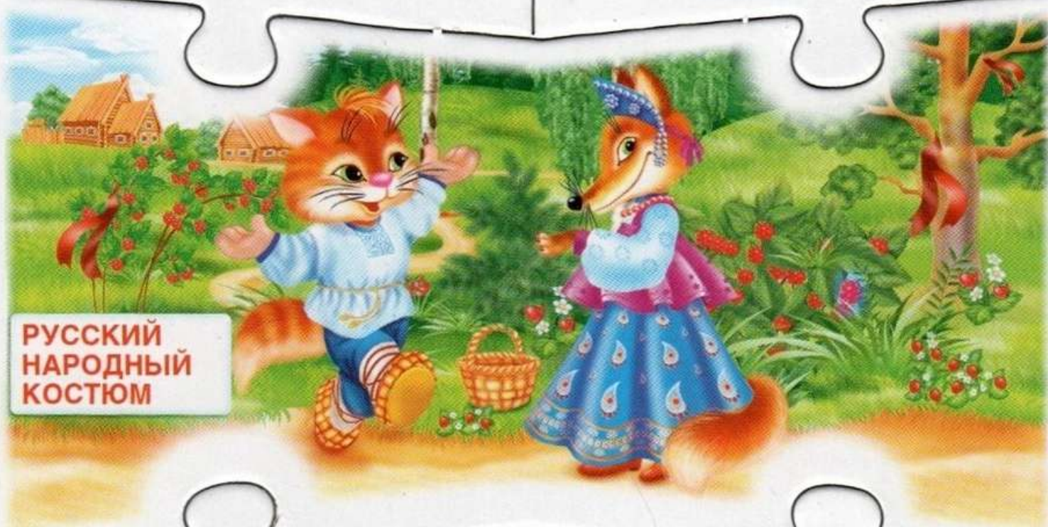
РУССКИЙ НАРОДНЫЙ КОСТЮМ