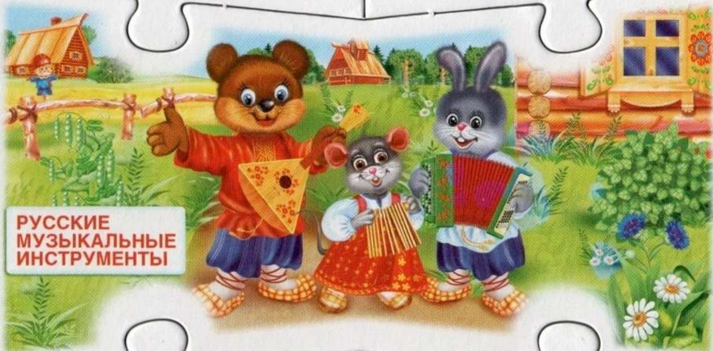
РУССКИЕ МУЗЫКАЛЬНЫЕ ИНСТРУМЕНТЫ